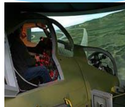
✓ динамики полета и систем управления