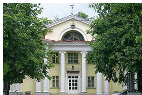
Научно-технический информационный центр (Дом учёных ЦАГИ)