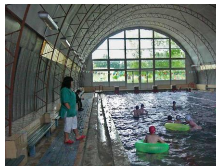
Оздоровительный комплекс «Салют»